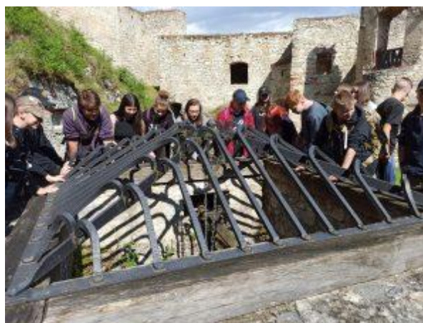
Školní výlet 8. A, B, Rabí