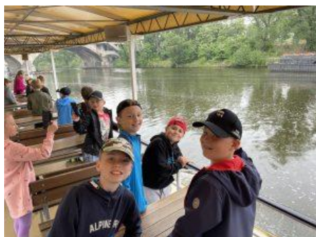
Školní výlet 3. A, B, ZOO Praha