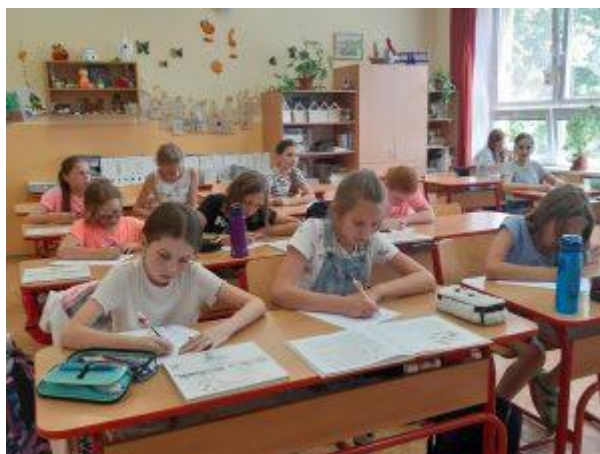
Čtenářská soutěž žákyň 4. – 5. ročníku