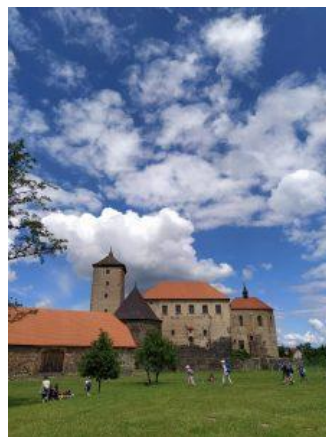
Školní výlet 2. B, Švihov