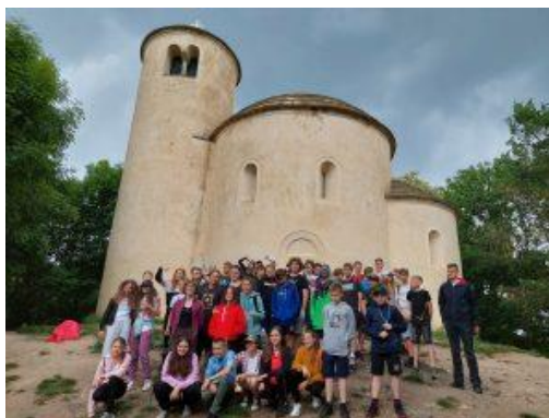
Školní výlet 7. A, B, Říp