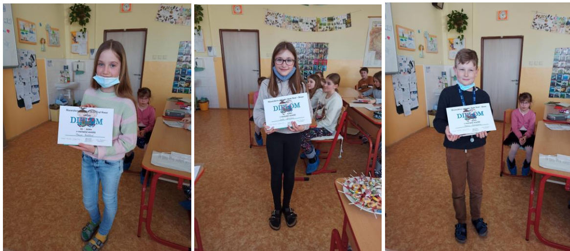
Vítězové z 5. ročníku