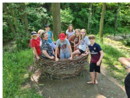
Školní výlet 6. A, C, Zeměráj