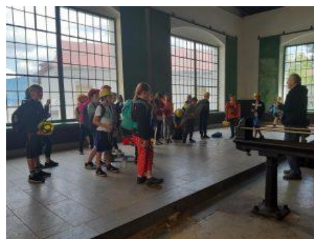
Školní výlet 4. A, B, Hořovice, Příbram