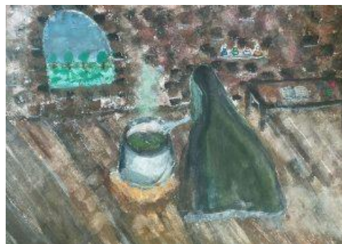
F. Vopat, Znetvoření K. Róthová, Víla v noční obloze C. Tischlerová, Doušek zeleného lektvaru

Vedle preventivních programů vedeme žáky i ke zdravému životnímu stylu . V šestém a sedmém ročníku to byl program Desatero primární prevence. Dále nabízíme dětem zdravé svačinky, zajišťujeme pro ně pitný režim, vytváříme odpočinkové a relaxační zóny. Mladší žáky si mohou ve škole zacvičit jógu. Nejstarší žáci se mohou touto problematikou zabývat podrobněji, např. pokud si zvolí předmět Výchova ke zdravému životnímu stylu.