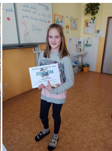
Vítězky ze 4. ročníku