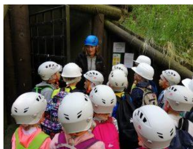
Školní výlet 1. A, B, Nevřeň