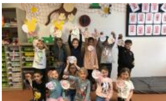
Sportovní odpoledne ke Dni dětí